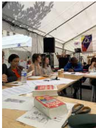
Atelier Maison des Écrivains