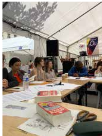
Atelier Maison des Écrivains